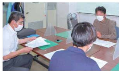
J A無料職業紹介所で求職者と面談（4月26日、朝来支所）