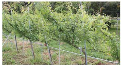
写真2 スモモのジョイント栽培