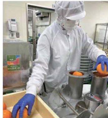
導入した果実スライサーを扱う従業員

お問い合わせは JA紀南産直係まで ☎0120-36-9159 (平日 9:00~16:30)