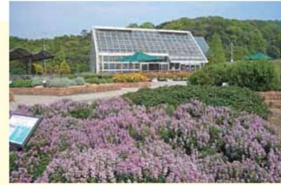
満開のラベンダー

(図2-1)。2回目は本葉5、6枚のときに行い、株間を6~10cmにします。間引きの根元を手で押さえて引き抜きます(図2-2)。最後の間引き後に1平方メートルあたり化成肥料50gを追肥し、株元に土寄せして株をしっかりと固定させましょう。収穫期近くには、根の肩の部分にさらに土寄せし、根が緑に着色するのを防ぎます(図3)。