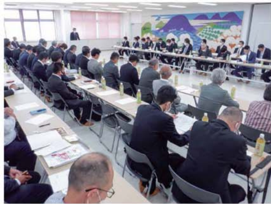
市場と産地の情報を交換した対策会議

飲販売を再開するという声が出た。課題となつてくる長期的な売り場づくりについても、「後半の熟した黄色い南高でもフルーティーでおいしいことを、もっとアピールできれば」といった意見が出た。