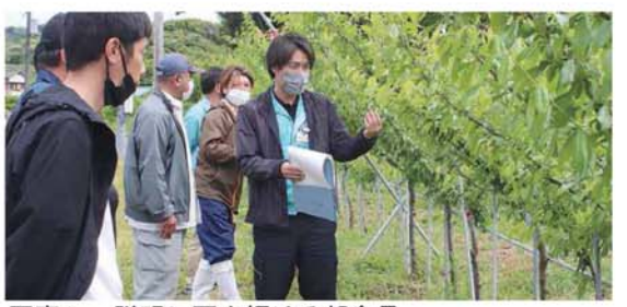
写真1 説明に耳を傾ける部会員

同会は、指導部が普及に向けた研究を進めている「ジョイント栽培」の実証圃場(写真2)も見学。一直線に植えた苗木の主枝同士を接木してつなげ、側枝をV字状に仕立てる栽培方法で、定植後早く収穫できることから改植後の早期成園化と、樹高が低い作業負担が軽減されるなどのメリットがある。部会からは収量や病害虫対策に関する質問や、「高齢になっても栽培を続けられそう」と期待する声があった。