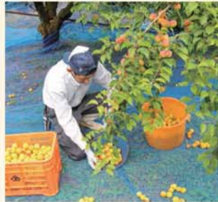
△ネット収穫は1日1回は園地を回る