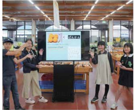
デジタルサイネージで上映している動画と制作に参加した児童ら

■先日読んだ本の中で劣等感と劣等コンプレックスについて語られていた。劣等感とは、目標や理想に到達できていない自分に対して劣っているかのような感覚を抱くこと。劣等コンプレックスとは、自らの劣等感がある種の言い訳に使い始め、本来は何も関係ないところにあたかも重大な因果関係があるかのように自らを説明し納得させてしまう状態のことだという。似た言葉に感じるが、全く意味合いが異なる。劣等感を感じるが、全く意味合いが異なる。劣等感を感じるが、全く意味合いが異なる。劣等感を感じるが、全く意味合いが異なる。