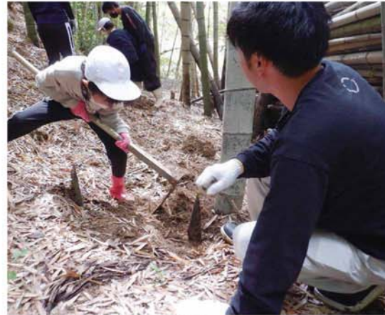
一生懸命くわをふるう児童