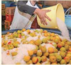
△漬け込み時の塩はこまめに振ること