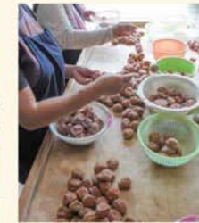
△等級・階級区分にしたがっての選別・タル詰め