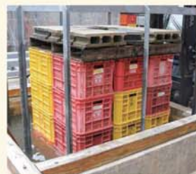
△漬け込み前の水浸漬作業