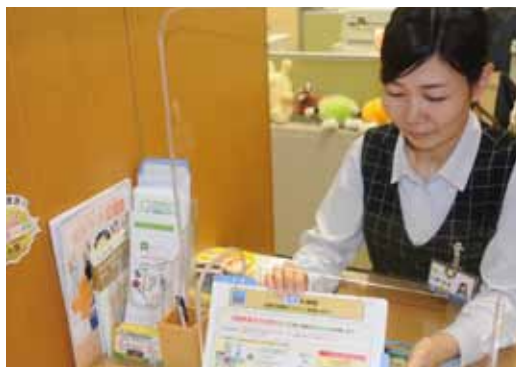
契約者様の加入内容を確認し最適なプランをご提案しています

JA紀南は組合員の皆様と身近でお仕事が出来ます。自分が生まれ育った土地で、地域の皆様のためにお仕事ができる喜びを一緒に共有しませんか？