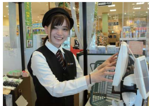
組合員・利用者と直接ふれあえるチェッカーの仕事もやりがいがあります