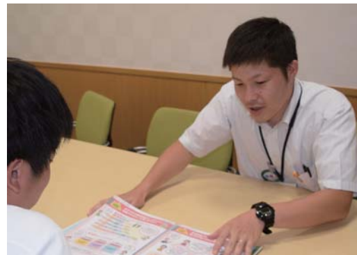
L Aとして皆様の様々なご相談に対応できる職員をめざします