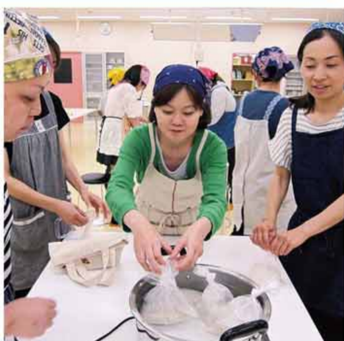
ポリ袋を使った炊飯に挑戦！

防災や備蓄の学習を目的に、調理器具が使えない状況を想定した料理研修を行いました。ポリ袋を使った炊飯や、包丁・まな板のかわりに、キッチンバサミなどを使ってスープや和え物を作りました。東日本大震災や熊本地震での実例などを交えた講義もあり、災害に備える心を新たにしました。(平成28年5月)