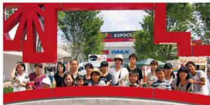
エキスポシティで思い出の記念撮影 (平成28年8月)

フレッシュミズ会員とJAの子ども向け雑誌「ちゃぐりん」購読者を対象に、親睦旅行を開いています。今年度は大阪府吹田市の大型複合施設「エキスポシティ」へのバスツアー。ホテルでバイキング形式のランチを楽しみ、工夫を凝らした展示が特長的水族館「ニフレル」を見学しました。