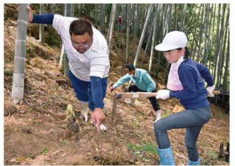
J A 青年部上富田支部が指導にあたった岡小学校のタケノコ掘り体験 (28年4月)

和歌山県とJA和歌山中央会が主催する平成28年度「和歌山県農業教育賞」の受賞校が決定し、上富田町立岡小学校が最優秀賞(知事賞)に輝きました。 県内の小学校を対象に、食農教育で大きな成果をあげている学校を表彰するもので、岡小学校の受賞は、全校児童が6つの縦割り班を組み、学年を超えて助け合いながら野菜を栽培していることや、地元での生産や、地域の生産者やJAの協力で農業体験を行い、地域との交流を深めている点が評価されました。 JA紀南も、地元の青年部上富田支部や上富田事業所、朝来、口熊野支所の職員らが、タケノコの収穫や米作りの指導、協力にあたっていま