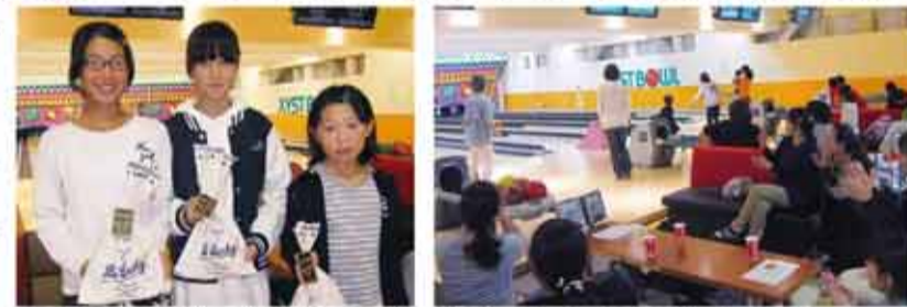
(平成28年11月) 子どもの部で見事入賞！和気あいあいとプレーし、好スコアに拍手！

親子が集まって親睦を深めようとボウリング大会を開催♪ チームに分かれての団体優勝と、大人の部、子どもの部での個人優勝を目指しました。誰もが楽しめるよう、お子さんはガター防止のレーンでプレー。ストライクが飛び出す度、ハイタッチを交わすなど、全員でプレーを楽しみました。