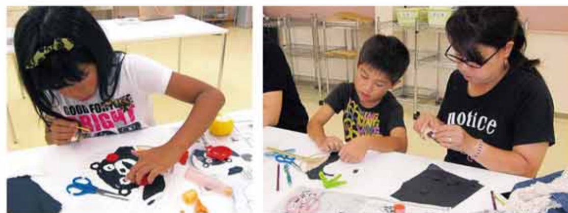
くまモンのお目めをベタベタ。かわいくできたかな。被災地の復興を願ってうちわづくり。細かな作業に大人でも悪戦苦闘

熊本地震の被災地を応援しようと、親子でちぎり和紙のくまモンうちわを作りました。うちわは、和紙に柄を転写するお手軽コースと、柄を転写してちぎった和紙を貼るじゅくりコースの2つから選択。参加費の一部を被災地に義援金として送りました。(平成28年7月)