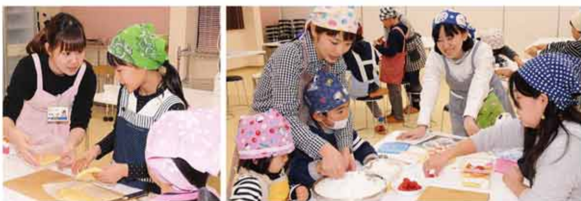
JAのお姉さんにも教わりながらのケーキ作り。イチゴや生クリームたっぷり！子どもたちからは「おいしそう！」との声

ガラス容器や深皿に材料を重ねて作るケーキで、複雑な飾り付けはなく、簡単に可愛く作れます。旬のイチゴをたっぷり使い、スポンジと生クリームが層になるよう敷き詰め、カットしたイチゴやジャムを間に挟みました。一番上にイチゴを丸ごと一粒乗せて完成しました。(平成29年2月)