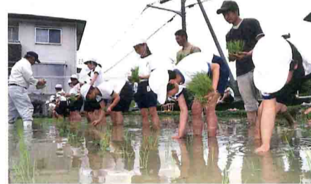
児童らが横一列に並んで田植え

で、初年度の今期は5歳から小学3年生までの20人が参加しています。11回の講座で基礎的な調理方法や栄養の知識を学んでいきます。地場産品の魅力を伝えることも目的で、食材は基本的にJ A のAコープから購入した地元産を使用します。第一回講座では子どもたちがおにぎりとお味噌汁作りにも挑戦しました。包丁を握る場面では、「野菜を抑える時はネコの手だよ」とアドバイスを受け、真剣な表情でネギやキャベツを刻んでいました。約2時間で梅、おなか、鶏そぼろの3種のおにぎり、野菜とシメジの味噌汁、イチゴのデザートが完成し、同伴の保護者とともに、出来立ての味を楽しんでいました。