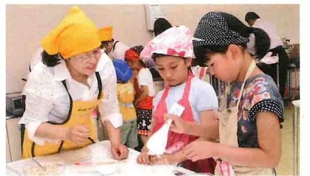
おにぎり作りに挑戦する子どもたち

J A 紀南は子どものための料理教室「なかよしクッキング」を今年度からスタート。5月15日にはJ A 中央購買センターJ A コピアで第1回講座を開きました。地元の管理栄養士グループ「栄養サポート紀南」が講師を務める教室