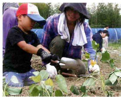
「収穫が楽しみ!」。お母さんと協力して植え付けたよ (白浜町才野で)

とんだ支所はサツマイモ60人集めて苗を植え付け J A紀南とんだ支所は5月9日、白浜町才野の農園に地域の親子ら60人を集めてサツマイモの植え付け体験を行いました。地域の方々に、農業について学んでもらい、J A職員とも交流を深めたいと、毎年開いているものです。今年管内に住む小学6