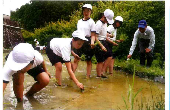
J Aの指導員の手ほどきで田植えに挑戦 (田辺市秋津川で)

J A紀南は5月11日と14日、田辺市の秋津川小学校の稲作体験授業に営農指導員が出席し、水田の代かきから