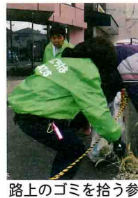
路上のゴミを拾う参加者ら (田辺市内で)