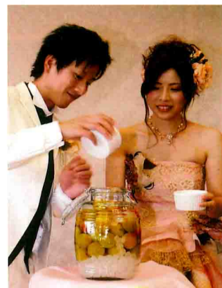
新郎新婦にも列席者にも好評の“ウエディング梅酒”

企画を取り入れたカップルからは「演出が素敵。遠方の方も、梅産地に合った演出だと喜んでくれました」との声が聞かれています。この梅酒は、冷凍南高梅を使うため季節は問いません。披露宴以外、誕生会や敬老の日、成人祝いなどの記念日に取り入れてみませんか。