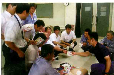
梅干しを配り熱中症予防を呼びかける田辺市の救急救命講習

今年もすでに熱中症の発生が報じられています。これからの暑い時期、紀州田辺うめ振興協議会も、熱中対策として水分補給と梅干しの活用を呼びかけています。