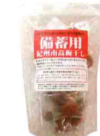
JA紀南の備蓄用梅干し

1個約20gの梅干しを個別に包装し、柔らかい樹脂の袋に約400g入れてあります。袋はジッパー付きで耐久性があり、中身の梅干しを取り出せば飲料水を入れることができます。価格は1,500円(税込)。