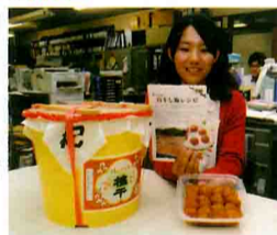
寄付者に贈る梅干しタル(田辺市・たなべ営業室)

田辺市が4月から、「ふるさと納税」で1万円以上を寄付した市外の方に白干し梅タル(4L、7kg)を贈る制度を始めています。5月23日現在の申出件数は210件。件数が最も多かった平成25年度の36件をすでに超えました。「紀州田辺・梅寄付者に贈る梅干しタルの香りお届け事業」と名付けたこの制度は、梅のPRとふるさと納税の促進を兼ね、田辺市がJA紀南と連携して取り組んでいます。梅干しは塩分約22%の白干し梅で、タルには白干し梅を使った料理レシピと小分け容器も入れています。