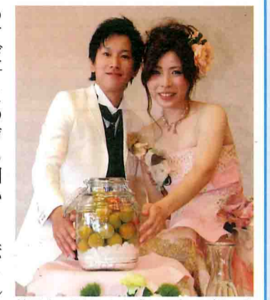
披露宴に取り入れた「ウエディング梅酒」好評でした。新郎新婦が新郎新婦が

J A 紀南は冷凍した「南高梅」を使った結婚披露宴での「ウエディング梅酒」のイベントを地元ホテルに提案しています。初めて「ウエディング梅酒」を行ったのは昨年11月、田辺市内の