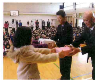
会津小学校での贈呈式(12月11日)

ボトルを持ってテーブルを回り、列席者が梅を入れ、最後に両家の親がホワイトリカーを注ぎ、新郎新婦が氷砂糖を入れると、会場は祝福の拍手に包まれていました。