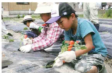
土に触れる体験も多い「あぐりすくーる」

JA紀南は6月15日、親子を対象とした農業体験講座「あぐりすくーる」を開校しました。参加した11組の親子に全6回のカリキュラムを通して農業や食べ物について学びます。「あぐりすくーる」は今年で3期目。小学校の低学年児童を対象に、野菜の種まきや収穫、育てた野菜を使った料理など、現地体験を中心にしています。