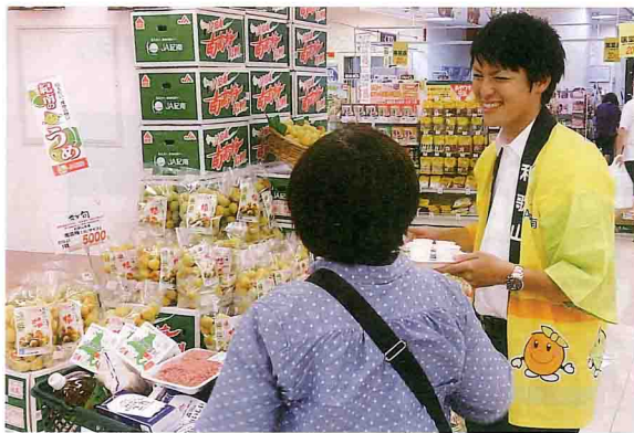
買い物客に梅の加工法をPRする隊員(千葉県柏市)

昨年JAに入り、栗栖川支所で共済事業の担当をしています。覚えなくてはいけないことがたくさんありますが、栗栖川は組合員の方も先輩方も親しみやすい方ばかりですので、常に笑顔で業務に取り組むことができます。まだわからないことも多いですが、早く共済担当者として一人前になれるように努力しています。趣味は旅行で、色々な所に行きたいと思っています。特に国内だけでなく、海外にも行ってみたいですね。