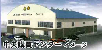
中央購買センター イメージ