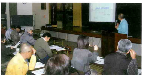
白浜町農業研修会館で開いた第1回講義

農業の圃場を借りて実習形式で進めます。あわせて受講生らは、自宅でも菜園やプランターで学習内容と同じ種類の野菜を栽培します。