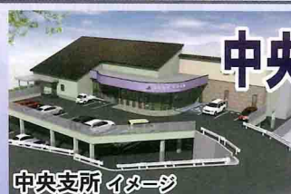
中央支所 イメージ