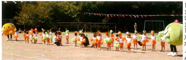
「紀州うめみかソング」を踊る秋津川保育所の園児とうめっぴ&みかっぴ

運動会当日、うめっぴ、みかっぴが登場すると、すぐに園児に取り囲まれ、握手や記念撮影に応じるなど大人気でした。ダンスでは、園児たち