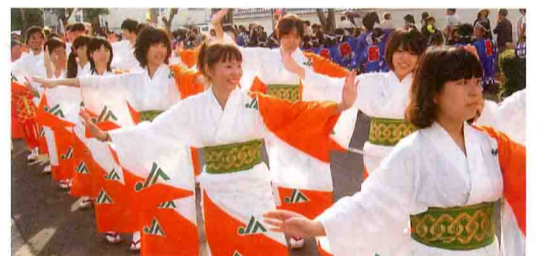
鮮やかな浴衣でゲタ踊りを踊るJ A 職員

第26回弁慶まつりが10月6日、田辺市の駅前通りやカッパークなどで催され、メインイベントの一つである「弁慶ゲタ踊り」にJ A 紀南チームが参加しました。今年、ゲタ踊りには田辺市内の各種団体から、過去最高の27チーム、1341人が参加。J A チームは田辺支所と新人職員を中心に50人が参加しました。