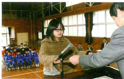
表彰状を受け取る安宅小の児童代表

白浜の安宅小が優秀賞 野菜の栽培から販売まで 第21回県農業教育賞 「第21回県農業教育賞」がこのほど決まり、白浜町立安宅小学校が優秀賞を受賞しました。野菜の土づくりから栽培、販売などを実践する取り組みが評価されたもので、3月15日には同校で表彰式が行われました。