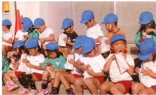
焼き芋をほおばる串本保育所の園児ら

J Aに勤務して2年目で、金融窓口を担当しています。1年目に比べ仕事には慣れてきましたが、8月に後輩が入ってきたので、しっかり頑張らないといけないという気持ちです。丁寧に優しく接することに心掛け、笑顔でのあいさつに努めています。 大学時代に合気道をして段位を得ましたが、就職してからは流派の関係でしていません。趣味はスポーツ観戦。プロ野球の阪神ファンなので、優勝争いをしてほしいと願っています。