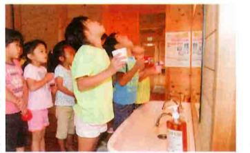
梅酢でうがいをする園児 (田辺市新庄町、わんぱく保育所で)

梅酢の持つ殺菌力を風邪予防に役立ててもらおうと、一昨年から運動を開始。子どもたちのうがいの励行につながる狙いもあります。 12月16日、厚生労働省からインフルエンザの流行期に入ったことが発表されたことを受け、協議会は希望があった9つの保育所、小中学校