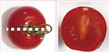
▲短径から切った断面図