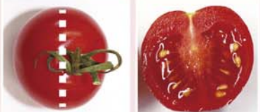
▲長径から切った断面図

ミニトマトは切る方向で断面が変わるのをご存じですか？ まずミニトマトのヘタをとって洗います。上から切るのですが、よく見ると楕円形の形をしています。楕円形の長い方(長径)を切るとゼリー状の果肉と種が見えてきます。短い方(短径)から切ると果汁も出なく種も出てきません。