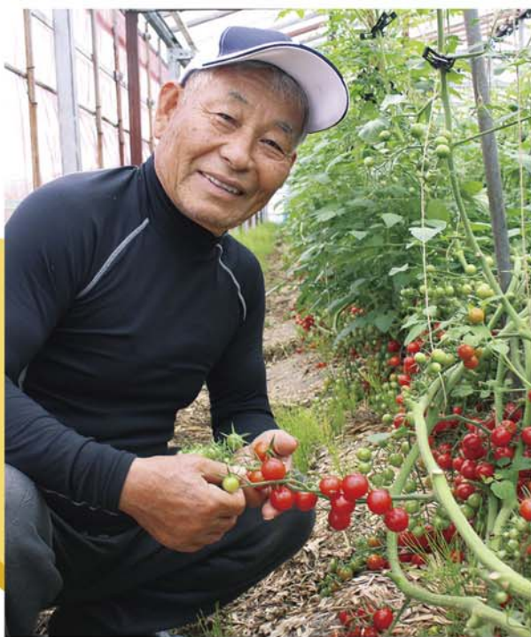
ミニトマト生産者