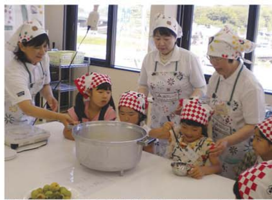
栄養士に教わりながら炊飯器に梅干しを入れて梅ごはんを作る児童

J Aの職員から、毎回の教科書として使っている雑誌の「ちやぐりん」について「J Aから学校にプレゼントしているけど、見たことある？」と聞かれると「読んだことあるよ」という返事が聞かれました。