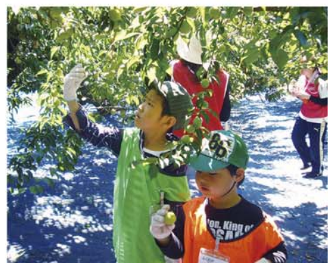
親子で梅もぎ体験をする参加者

J A紀南は6月16日、第8期「あぐりすくーる」の第2回講座を田辺市の三栖地区で開き、親子51人が参加しました。