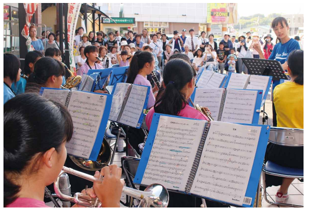
来客された方々を前に演奏を披露する高雄中学校 brassバンド部の皆さん (AコープCOOK-GARDENで)

JA紀南のAコープCOOK-GARDENでは8月25日、サマークリスマスコンサートから拍手があふれて