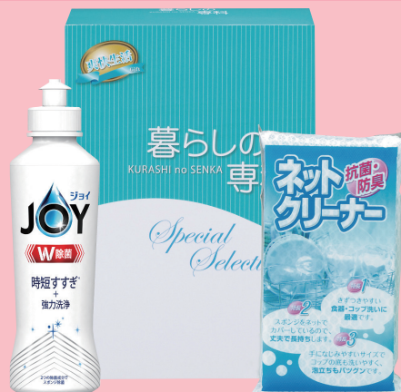
爽快生活キッチンセット