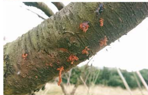
フラスが発生した木の根元(上)と枝

食入された木からはミンチ状のフラス（虫糞と木くず）が排出されるのが大きな特徴だ。活動範囲は半径数キロといわれている。