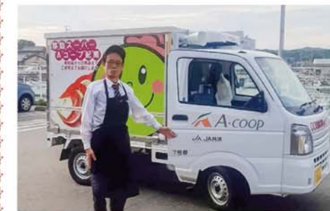
串本で運行する移動スーパー

毎月末に給食担当者との会議を行って、翌月の納品献立に基づいた生産を行い、年間を通して給食センターへ納品している。昨年度は約12トンの野菜を納品した。