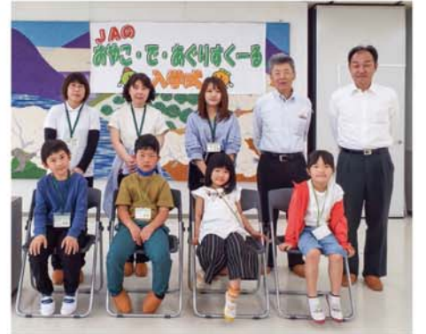
入学式に出席した親子たち