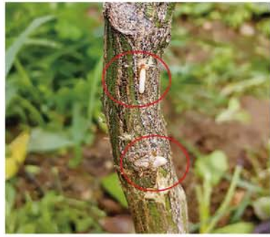
苗木に産卵したゴマダラカミクリムシの卵

7月中・下旬からゴマダラカミクリムシの産卵が始まる。特に株元から幼虫が入り幹を食い荒らされると樹勢の低下やひどい場合は木が枯れる場合もある。そのため、7月中旬頃に主幹から株元散布としてモスピラン顆粒水溶剤(20