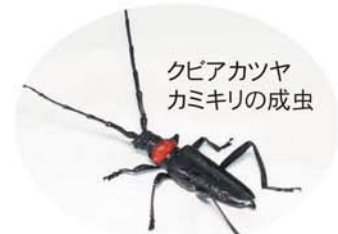
クビアカツヤカミキリの成虫