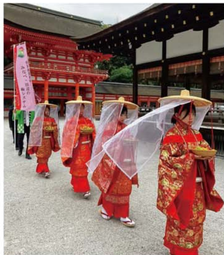
京都の上賀茂・下鴨両神社では、平安衣装をまとった女性らによる時代行列「紀州梅道中」を4年ぶりに実施し、南高梅を奉納しました。沿道の人々や観光客などからも注目を集めていました。