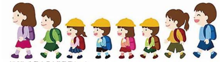
(公財) 和歌山県人権啓発センター *学校名・学年は応募当時のものです。写真はイメージです。

「いちねんせいになって」 じんけんってどんなこと？ がっこうでならったよ。 それは、ひとのけんり(きんり)。 いきるけんりのこと。 じゆうなけんりのこと。 べんきょうするけんりのこと。 いじめられないけんりのこと。 しあわせになるけんりのこと。 わたしは、いちねんせいになって いまがっこうがたのしいよ。 おともだちもみんなたのしいうに みえるよ。 でも、こころのなかで ないてるおともだちはいないかな。 わたしは、じぶんがなくとも、 おともだちがなくとも、かなしいよ。