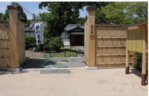
写真1 鈴木屋敷正門入口

【病害虫の防除】高温期にアブラムシなどが発生しますが、比較的病害虫は少ない野菜です。発生が多いときはモスピラン顆粒水溶剤を用います。 の化成肥料を施し、株元に土を寄せておきます。マルチ栽培では1回目はマルチ穴に、2回目は栽培床の両側に施し、土を寄せておきます。