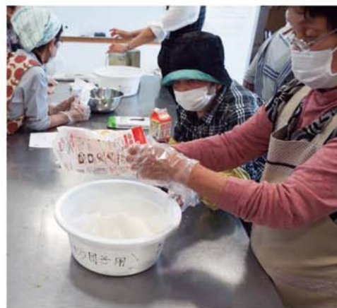
ゴキブリ団子を作る会員