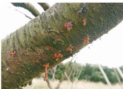
クビアカツヤカミキリの被害にあった樹

回答 成虫で2〜4センチ程度、首が 赤いのが特徴です（6ペー ジ参照）。薬剤はありますが、木 の中にもぐっているため、基本的 には伐採・伐根になります。詳し