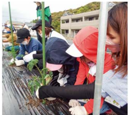
第1回講座は「夏野菜の植え付け体験」

閉式後は1組の親子も合流しJAの学童農園に移動、第1回講座「夏野菜の植え付け体験」とし