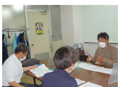
無料職業相談事業のマッチングの様子

回答 JA 紀南としては現在合 併の協議に参加している ため、令和7年4月の合併に向け て線上に乗っています。経営の将 来シミュレーションをきちんとし て取り組んでいきたいところで すが、合併協議会では、事業利益段 階で黒字であれば良いという考え で、各JAの課題提示には至って いない状況です。来年の6月の合 併総会頃にはある程度課題が示さ れるのではないかと思います。確 定した各JAの決算についてはデ ィスクロージャーで確認できます が、将来的なものは示されており ません。なお、JA 紀南のシミュ レーションに関しては、5年先ま ではある程度職員レベルで試算で きますが、10年先となると専門家 に依頼することも考えています。