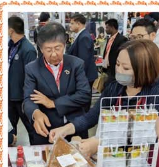
在タイ日本国大使館の梨田和也大使(左)に梅を紹介

このほか、消費地での梅加工講習会や、千葉マリンスタージアムでの梅PRなど宣伝活動も強化している。