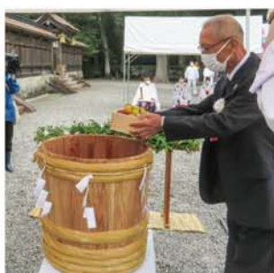
田辺市の本宮大社では、紀州田辺梅干協同組合が南高梅を奉納。梅農家やJA・行政加工業者らが参列し、漬付け梅儀式を行いました。

JA紀南は5月23日から27日にかけて、タイのバンコクで開かれた総合食品見本市「THAIFEX 2023」に参加し、梅干しやドライフルーツをPRした。世界40カ国から10万人が訪れる最大級のイベントで、はちみつ梅が好評を博した。ドライフルーツにはベトナムや欧米諸国からの関心が高かった。