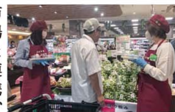
消費者に梅ジュースを勧めるJA職員ら