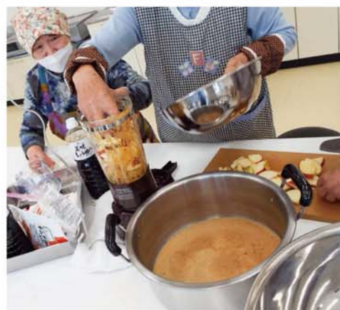
焼き肉のタレを作る会員