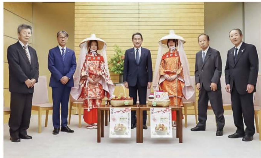
16回目となる首相官邸への表敬訪問。昨年に続き岸田文雄総理大臣に紀南の青梅と梅干しを贈呈しました。紀州梅の会の真砂充敏会長（田辺市長）が梅をアピールし、和やかなムードでやり取りがあった中、梅干しを試食した岸田総理は「酸味があっておいしい、元気が出る。梅は健康に良さそうでいろんな可能性がある」と感想を述べました。