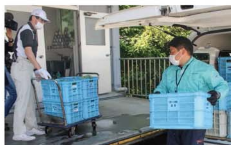
キャベツを納品するJAの担当者(右)

JA紀南すさみ支所は5月上旬、白浜町のレジャー施設「アドベンチャーワールド」に、動物飼料として春キャベツの出荷を始めた。規格外品として破棄されるものも買い取ってもらえることから、JAの担当者は「生産者にもメリットがあり、地場産を動物飼料に使っていただけありがたい」と話す。