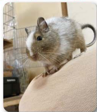
たきくん (♀) オス