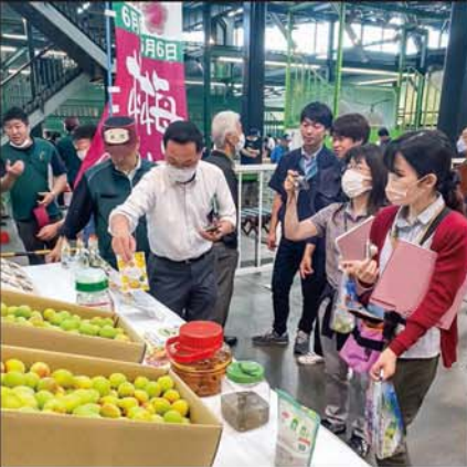
大田市場で行った和歌山の梅フェア。市場関係者に紀州の梅を大いにアピールしました。

田辺・みなべのJAや行政でつくる「紀州梅の会」が、平成18年に6月6日を「梅の日」に制定して以降、「梅のある暮らし」を広げようと、さまざまなイベントやPR活動を行っています。今年も東京・大田市場での梅フェアや京都の時代行列など、コロナ禍以前の記念行事が復活し、日本の梅をアピールしました。