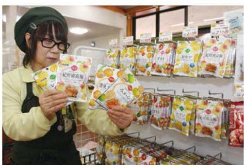
ドライフルーツで消費拡大に取り組む

梅干しの売れ行きは鈍っ ており、消費は20年前に 比べて3割ほど落ち込んでいま す。JAでは梅干し以外に形を変 え、梅肉やドライフルーツの消費 拡大に取り組んでいるところで すが、梅を販売するための研究は進 めているものの、十分な成果につ ながっていません。一方で新たな 取引先もできていることから、販 路を拡大していきたいと考えてい ます。近年取引先からは、加工品 の安全を担保する要望が強くなっ てきており、施設の改修や増強等 に備えるため加工事業強化積立金 を提案させていただきました。