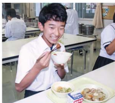
田辺市内の学校給食では梅を使ったメニューが出されました。「おいしい」と笑顔の児童(6月2日、田辺市立大塔中学校で)