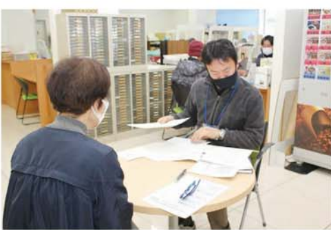
肥料高騰対策の受け付けをする職員

質問 生産資材価格高騰対策に 取り組んだとあるが、今 後は結果を数値化するなど、具 体的に示すことで、組合員として 納得を得やすいと思われるので 検討いただきたい。