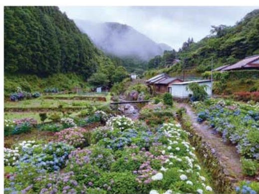
令和3年撮影 中辺路町石船

の環境も大きく変わっていましたので、それに応じた必要な見直しをすることができました。自分なりに、自分の人生を少しでも前向きに整理できたと思います。 終活に対する感じ方もやり方・目的も、人それぞれですが、皆さんももし興味を持たれましたら、各支所にエンディングノートを備えてありますので、お声かけの上ご覧いただけたらと思います。 今回は、将来に向けたお金の話を中心でしたが、当然、「今」使うお金も重要です。新型コロナが終息しつつある中で、この3年間にできなかったことにも挑戦していきたいと思ひます。この号が出る頃には、あじさいが見ごろになっていると思います。