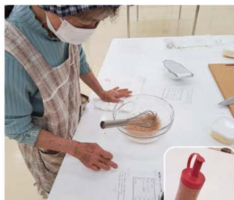
レシピを確認する会員