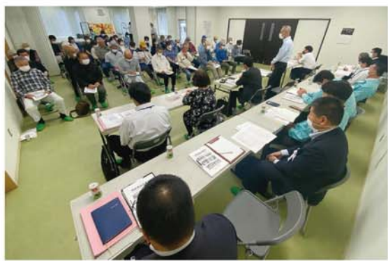
多くの意見などが出た地区懇談会（5月15日、秋津川店）

J A 紀南は5月12日から18日にかけて地区懇談会を開き、34会場 で379人に出席いただきました。組合員からは、県1 JA 合併や各 事業に対する要望や今後の方針への意見など、各会場でいただいた ご意見やご提案を要約・整理しましたので、本誌でご 紹介します。