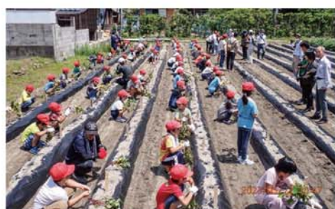
サツマイモ苗を植え付ける周参見小の児童ら

JAすさみ支所とアドベンチャーワールドは5月22日、すさみ町の周参見小学校児童とともに、サツマイモ苗の植付けを行った。秋に収穫後、パークの動物飼料として与える予定だ。