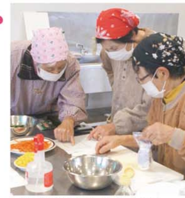
レシピの詳細を確認しあう会員

材料の切り方や調味料の分量を確認しながらそれぞれを調理し、おいしそうなおせち料理が完成しました。 (朝来支所・巨海千都佳)