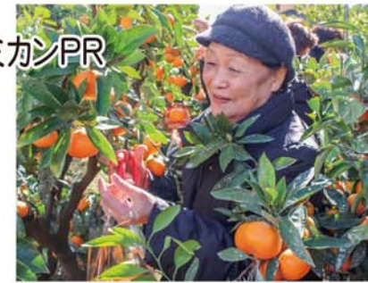
収穫を楽しむ参加者

JAでは11月中旬に説明会を開き、希望者へ肥料の供給明細と申込書を配布。事前に簡単な必要事項等を入力してもらい、12月から本受け付けを行った。営農経済職員がチェック項目の確認や、詳しい支援の説明をし