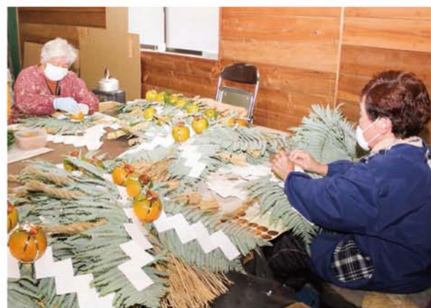
ひとつずつ手作業で行うしめ飾りづくり

本体部分となるしめ縄は、地元出荷者ら7人でつくる「なかへちしめ縄生産部会」が、1年かけて生産したもの。4年度産はワラの状態が非常に良く、品質のいいものに仕上がったという。