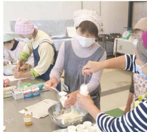
お菓子作りを進める会員

材料の切り方や調味料の分量をレシピと照らし合わせて確認しながら、4つのグループに分かれてそれぞれを調理。メニューによっては調理が大変なグループもありましたが、みんなで助け合う姿が見られました。 (朝来支所・巨海千都佳)