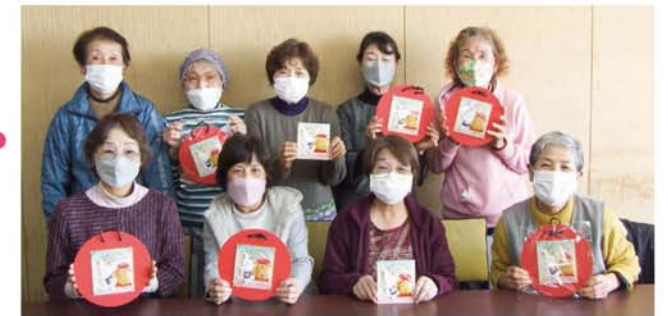
出来上がった作品を手に記念撮影

押絵はウレタン素材に和紙をくるみ作成するもので、くるんだものを後で組み合わせて干支の形にします。今回はうさぎということで、ほぼ白色で小さなサイズのパーツや、丸い形が多く苦戦しながらも「自分の干支まで参加できるやらか?」「オンリーワンでかわいい~」「もうお正月きたよ」といった声が聞かれました。(白浜地区センター・南部仁美)