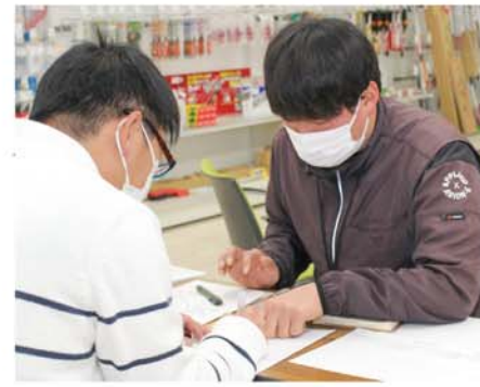
受付を行う営農経済担当職員

この事業は、肥料価格の高騰による農業経営への影響を緩和しようとして、国が肥料費の一部を支援するもの。支援を受けるためには、販売実績があり、化学肥料使用量の2割低減に取り組むことが必要で、今期は肥料費から14・4%の支援金を受けられる。