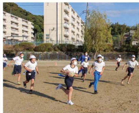
タグラグビーを楽しむ稲成小の児童