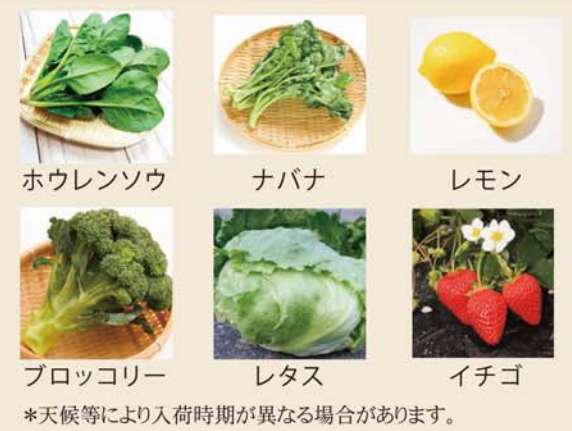
*天候等により入荷時期が異なる場合があります。