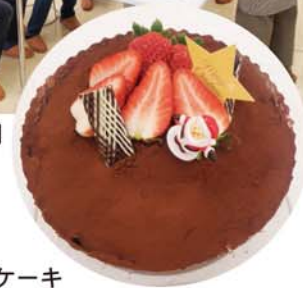
完成したティラミスケーキ