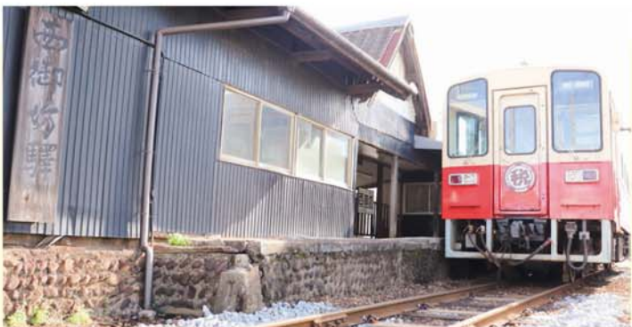
西御坊駅に停車している様子

JR御坊駅の0番線から出発する「紀州鉄道」は、営業距離2・7キロメートルの日本一短い鉄道として知られ、時速約20キロでトコトコと走る姿を一目見ようと、全国から鉄道