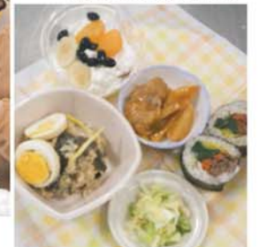
完成したおせち料理