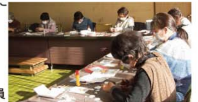
作業を進める会員