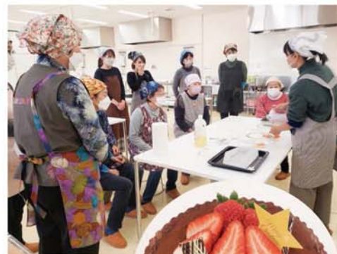
米山さんの説明に耳を傾ける

会員からは「孫と一緒に食べます」「家で子どもと一緒に作りたい」といった声が聞かれました。 (ふれあい課・和田裕子)