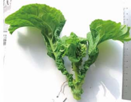
写真② 菜の花の収穫適期