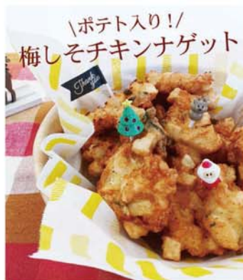
梅料理のレシピをインスタで投稿