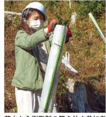
苗木から樹脂製の筒を外す参加者

植林伐採跡地を元の自然に戻そうと、JA紀南は2009年から「照葉樹の森づくり運動」に取り組んでいる。12月10日には田辺市巾着町の山林に、地域の団体と職員ら37人がボランティアで集まり、過去に植樹した苗木の手入れや、地元の中学生在が育てたドングリ苗100本を植え付けた。