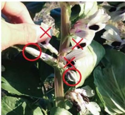
写真① ソラマメの摘花（2花残す）

生育が順調であれば1節に5つ花が着く、上側の3花は摘み取り、下側の2花を残す。株への負担軽減と、莢の肥大促進に摘花は早めに行う。（写真①）