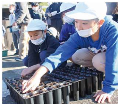
ドングリの種まきをする児童

遊休農地を活用したウバメガシの森づくりに取り組む田辺市の秋津川振興会は12月6日、地域住民や地元の小中学生らと協力し、ドングリの種まきやウバメガシの植樹などを行った。 秋津川地区では、農業従事者の高齢化や後継者の減少に伴い、遊休農地が増え有害鳥獣のすみかとなっていることが問題視されている。一方、当地域は紀州備長炭の発祥の地とされ、原木のウバメガシ林の確保が喫緊の課題でもある。 そのような中、同会では