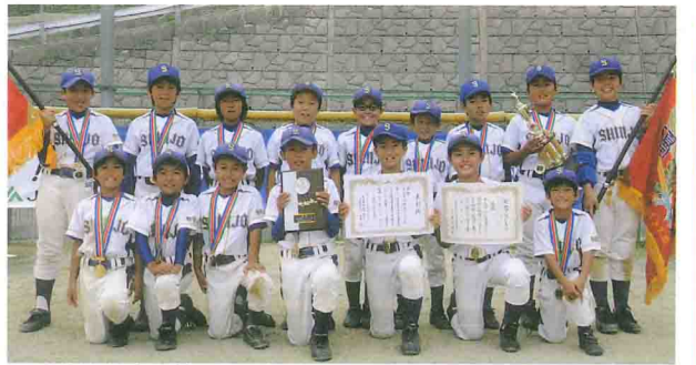
5試合を好守で競り勝ち優勝した新庄少年野球クラブ

J A 紀南は10月5、11、12日の3日間、田辺市の上秋津若者広場など6会場で「第9回西牟婁支部 J A 共済旗学童軟式野球大会」を開き、決勝までの全試合を競り勝った新庄少年野球クラブが優勝しました。大会は「第34回メイトスポーツ旗争奪学童軟式野球大会」を兼ね、田辺・西牟婁地方の22チームが熱戦を繰り広げました。決勝戦は鮎川と新庄が対戦。1回裏に2点を先制した新庄が、6回にも1点を追加し、3対0とリード。6回表の鮎川の反撃を1点に抑え、3対1で新庄が逃げ切りました。新庄は、2回戦の三栖戦では1対1のまま特別延長で勝利。準々決勝以降の3試合も、すべて相手を最少失点