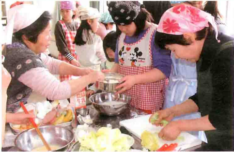
女性会員が小学校に出向いての料理教室(中芳養地区)

J A紀南の青年部と女性会もさまざまな食農教育活動に取り組んでいます。 青年部では毎年、小学校の新入生へのお祝いに梅干しをプレゼントしています。 「紀南自慢の特産品を子どもたちにも知ってもらい、食べてもらうことで、地産地消に繋げたい」との思いで取り組んでいます。