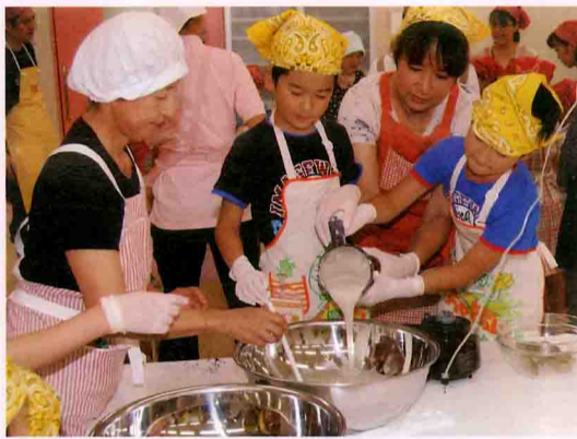
手作りこんにゃくに親子で挑戦！

講座も、野菜の種蒔きから収穫までの一連の農作業、牛乳パックでの和紙作りや地域散策、料理など、幅広く取り入れられています。 25年度は6月から11月までの半年間で開校。夏野菜の収穫やこんにゃく作り、梅採りなどのカリキュラムで楽しんでもらいました。