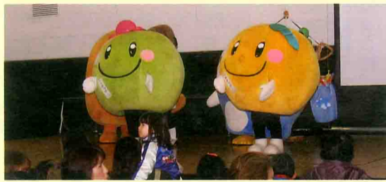
地元イベントに参加する「うめっぴ&みかっぴ」(昨年12月)