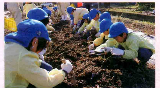
園児たちが学童農園でサツマイモを収穫

2月にはジャガイモ種の植え付け、6月にジャガイモの収穫とサツマイモ苗の植え付け、11月にサツマイモの収穫を行っています。 農園では子どもたちがスコップを片手に大はしやぎ。虫やカエルなどの生き物を観察したり、土にふれる楽しさを体験してもらったりと、畑ならではの楽しさを感じてもらっています。