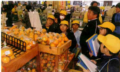
直売所に並んだ農産物を見て地産地消を学ぶ(秋津町の紀菜柑で)

J A紀南は、学校などのJ A施設見学を積極的に受け入れており、子どもたちの社会科見学の人気スポットとなっています。