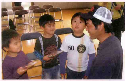
青年部から小学校の新入生に梅干しをプレゼント(田辺市立大坊小学校)

青年部支元の子どもたちの田植えや稲刈りなどの体験学習に一役買っているところもあります。 女性会では、小学校に料理の講師として出向いたり、支所の調理室に小学生を招いての料理教室を行っているなど、地元で採れる食材を使った郷土料理や、簡単に作れるデザートまで、これまで多くの子どもたちに手ほどきしてきました。