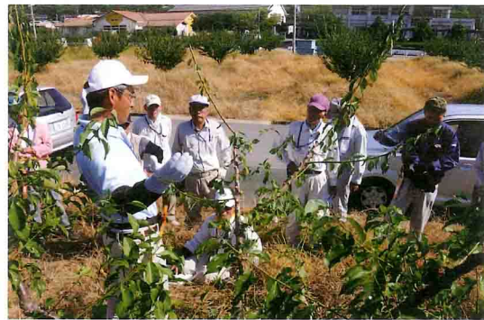
JA営農指導員の剪定実技を見る参加者(田辺市中三栖)

上芳養支所で営農指導員をしています。モットーはスムーズな対応と丁寧な仕事。最初は知識不足で苦労しましたが、頑張り次第で相談を持ちかけてもらえるのだと分かり、この仕事にやりがいを感じています。農業は天候の影響があり、作った物の販売情勢も変化中、現場のさまざまな問題に対処できるように勉強に励みたいですね。趣味は買い物で、よく洋服を買いに大阪に行きます。釣りに興味があるので、今後覚えていきたいです。