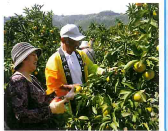
14回目を迎えたコープこうべのみかん狩り