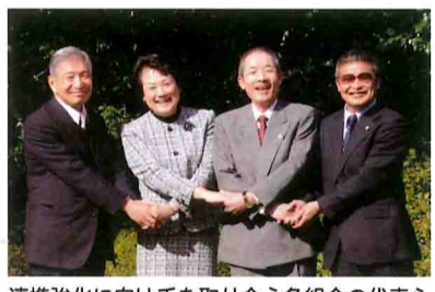
連携強化に向け手を取り合う各組合の代表ら

2013年も連携を 協同組合代表者が座談会 J A広報誌の企画 2012年が国際協同組合年だったことを契機に地域の協同組合間の連携を深めようと、J A紀南は12月4日、地元漁協、生協、森林組合の代表を招き座談会を開きました。