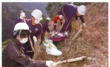
森の再生を手助けしませんか(写真は昨年のも)

開催日: 平成25年2月3日(日) 雨天の場合は10日(日)に順延 集合時間: 午前9時 集合場所: 田辺市立 二川小学校 グラウンド (田辺市中辺路町川合1448) 植樹場所: 田辺市中辺路町小松原 内容: J A役員、女性会会員、地元中学生、いちいがしの会会員らと照葉樹を中心とした苗木の植樹を計画しています。 参加費: 無料(弁当付き) 備考: 集合場所からマイクロバスで移動後、徒歩で1.5kmほど歩きます。植樹場所は山の傾斜地になっています。